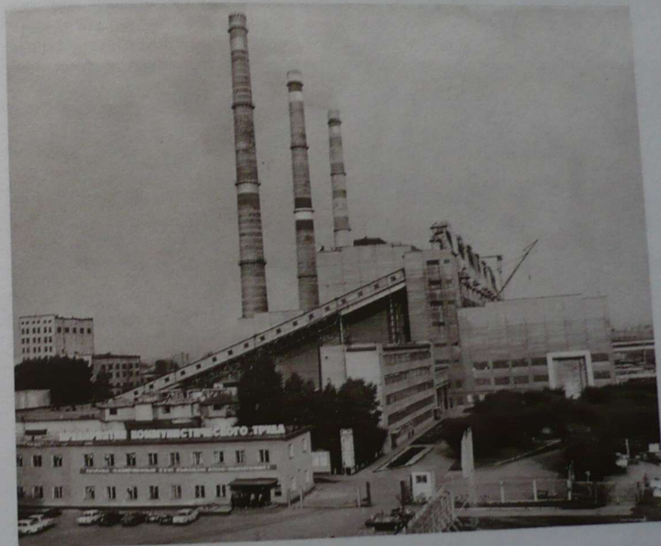
Фото 40. Беловская ГРЭС

ГРЭС, ГОСУДАРСТВЕННАЯ РАЙОННАЯ ЭЛЕКТРОСТАНЦИЯ БЕЛОВСКАЯ "Кузбассэнерго". Электростанция высокого давления. Установленная мощность — 1200 тыс. кВт. 6 котлов и турбин станции установлены по блочной схеме. В качестве топлива используется кузнецкий уголь. Расположена около г. Белово в пос. гор. типа Инском (фото 40). Проектные работы осуществлялись Ленинградским отд-нием ин-та Теплоэлектропроект (гл. инженер проекта — О.Б.Эбин), а с 1977 — Новосибирским отд-нием этого же проектного ин-та. Сооружение станции осуществлялось под рук-вом засл. строителя РСФСР Г.И.Томилова. За короткое время был создан 5-тысячный коллектив строителей. Многие строители и монтажники перешли с Томь-Усинской ГРЭС.