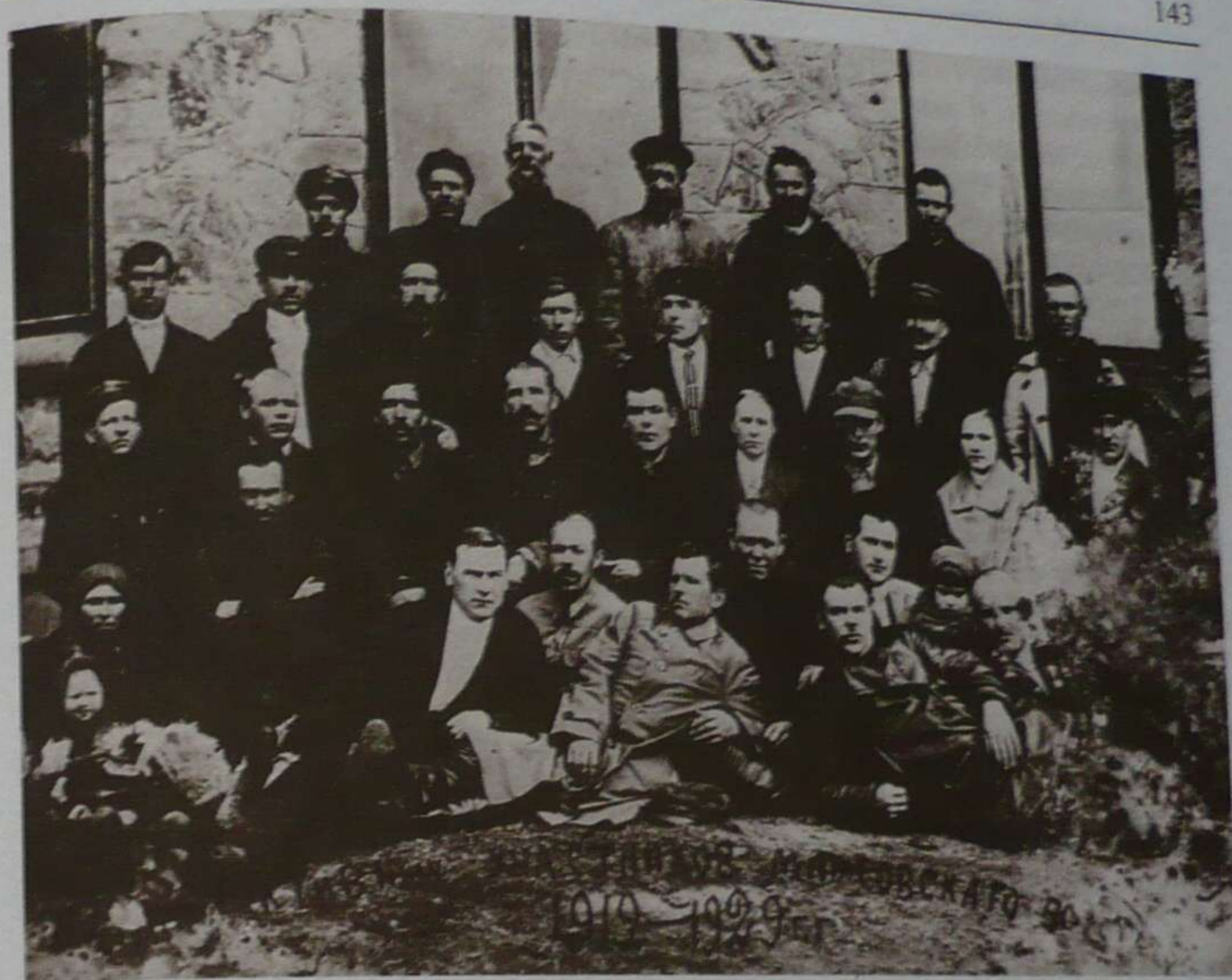
Фото 38. Участники мартовского восстания 1919 года